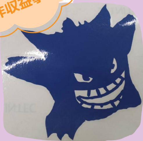
学習支援教室 りそなYOUTHBASE