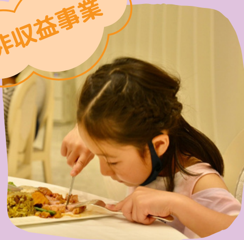
子ども食堂 フラールガーデン春日部